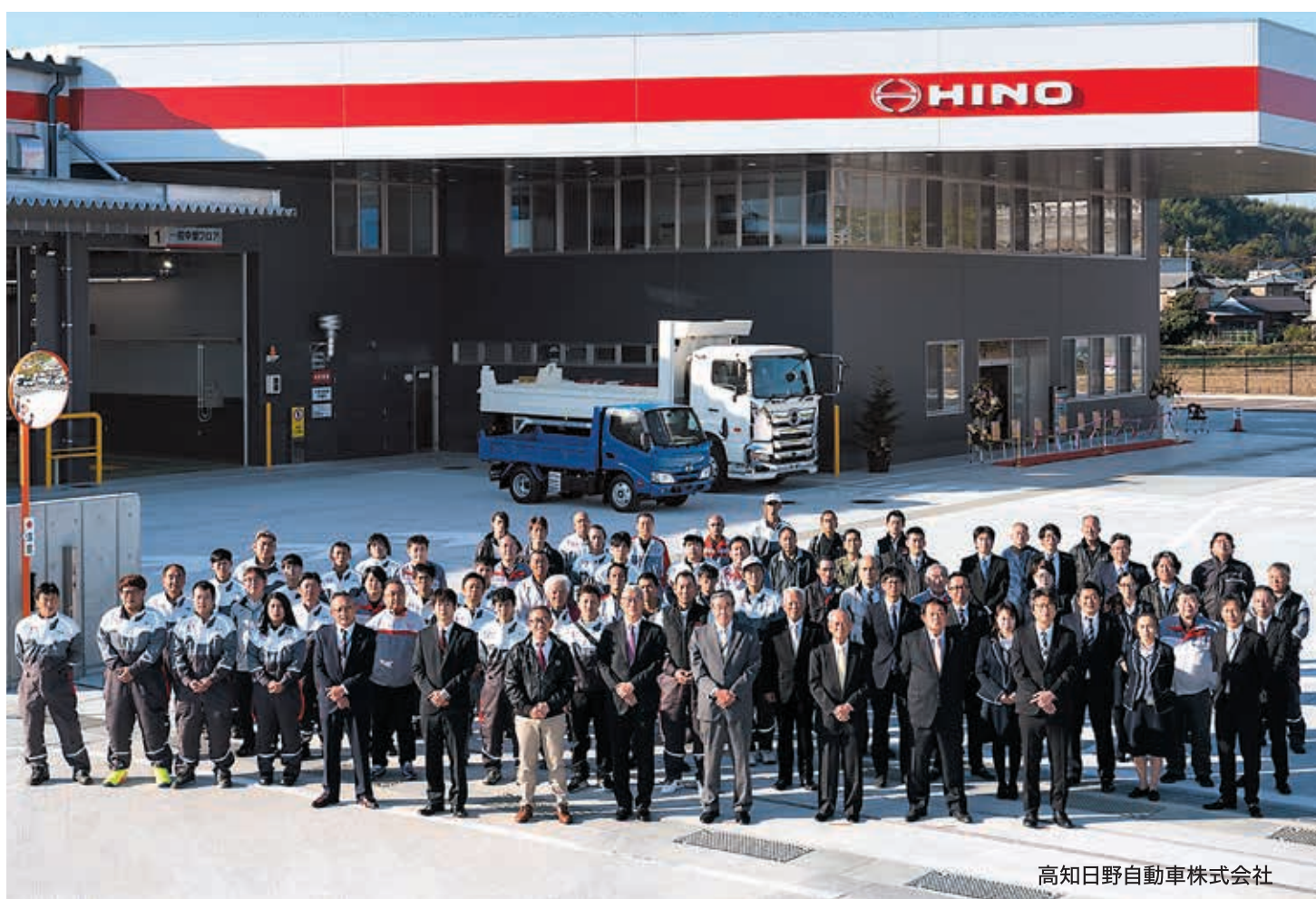
高知日野自動車株式会社