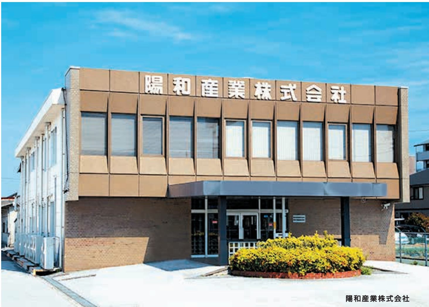
陽和産業株式会社